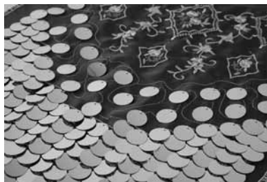
製品による加工の様子

繍機は、他社の追随を許さない優秀な機械として、世界各国のユーザーから多大な評価を得ています。弊社、東海工業ミシン(株)はタジマグループの中核として、厳しい品質管理体制のもと、高品質の製品を開発、設計、生産しています。