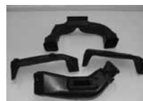
自動車用エアコンダクト