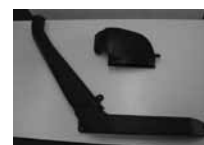
自動車用インレット