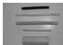
工業用ジャバラホース

弊社は1961年の創業以来、おかげさまで50周年を迎えることができました。ブロー成形ひとすじのなか、昭和50年よりインパネおよびエンジン廻りの自動車部品を主力とし生産しております。現在では外装、内装全般にわたりブロー成形品としての提案→試作→量産の一貫体制をしております。技術・