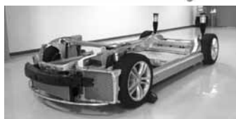
テスラ・モデルS シャーシとバッテリーなど展示予定

会期：2012年11月28日(水)～30日(金) 会場：ポートメッセなごや(名古屋市国際展示場) 『日本のものづくりを考える3日間』