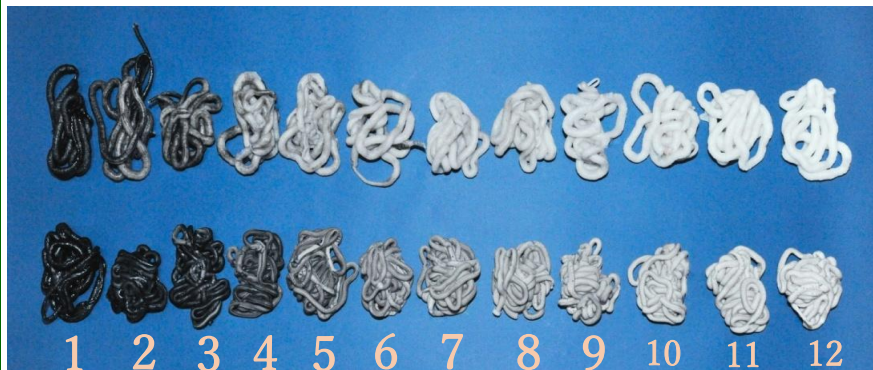
洗浄効果比較 : 上段＝「HaGaSIX」 下段＝「他社製品」

洗浄剤は、多用途で万能なものはありません。近年は、特にアジアの日系企業を始め、海外でも使用頻度が増加しており、さらに質の高い洗浄剤が求められております。今後もさらにお客様の要望を吸収し、新たな洗浄剤を逐次開発していく所存です。