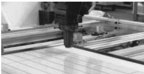
レーザー罫引による消えない罫線の実用化