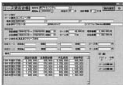
支払済リース料やリース残額を確認します

※MS-Accessは米国Microsoft社の米国及びその他の国で登録されている商標です。