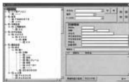
面倒な物品の所在管理も簡単指示