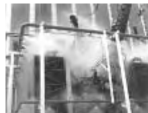
高電圧トランス防護 水噴霧設備