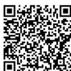
名古屋 おしえてダイヤル