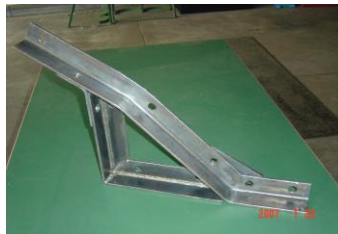
1 級 検 定 作 品 の 例

構造物製作に係わる技術知識及び技能を習得し、併せて国家資格技能士1級および2級習得を目指した下記講座を開設します。興味のある方は、資格習得を目指し、奮って参加挑戦して下さい。