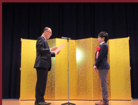
令和7年度授賞式の様子