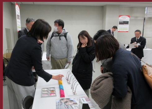
グランプリ受賞技術・製品展示会の様子