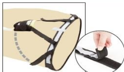
腰上げ不要、フリー調整