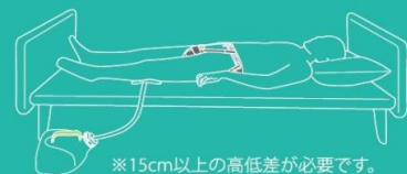
※15cm以上の高低差が必要です。

ダンディユリナーは装着式の男性用集尿器です。 臥位(仰向き/横向き)で使用可。 うつ伏せは不可。