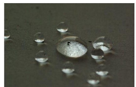
撥水処理したコンクリート