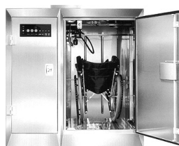
燦 RCM マットレス消毒機

創業以来、豊職人のこだわりの「技」を、永年の機械作りの経験に先端技術を駆使して、日本が誇る「豊文化」を支え、豊業界にてシェア50%を誇るトップメーカーとなりました。1990年代に入り、豊業界で培った「乾燥技術」を基に、新規分野へ参入。布団乾燥機や野菜乾燥機の開発を経て、医療・福祉分野へ、清潔な暮らしを実現する環境改善製品のバイオニアとして注目を集める。卓越した乾燥技術は、