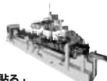
「貼る」 ラッピングマシン