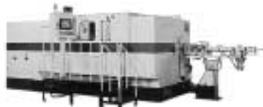
精密ボルト用圧造機