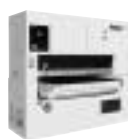
「磨く」 ワイドベルトサンダー