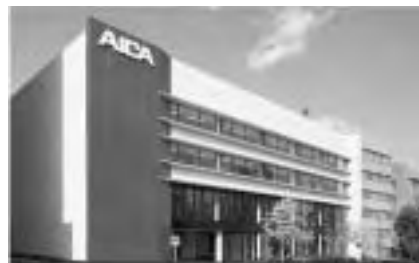
名古屋ショールーム／千種区末盛

ザイン力」にあります。この特長を最大限発揮しかつ持続的な成長を達成するため、営業力の強化による国内市場の拡大、海外市場の開拓や原価低減の推進