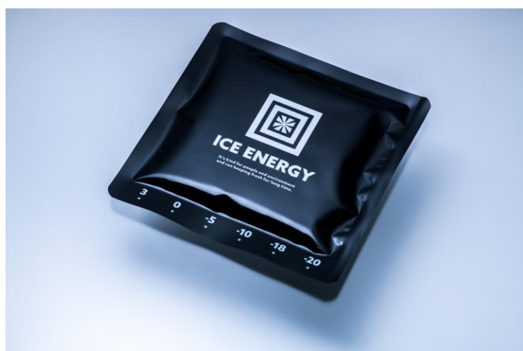
アイスエナジー ソフトケース300g