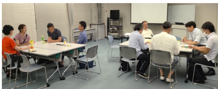
起業カフェの風景