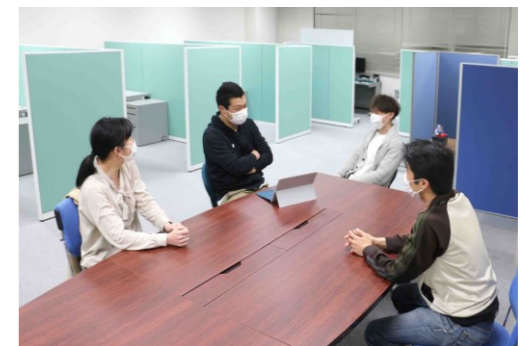
共有スペースでの交流

※賃料・使用料 無料 ※デスク/椅子/専用ロッカーを完備しています ※インターネット 無料 (Wi-Fi完備)