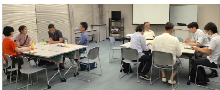
起業カフェの風景