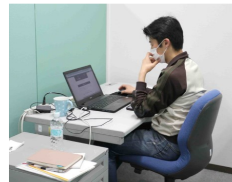
デスク使用イメージ